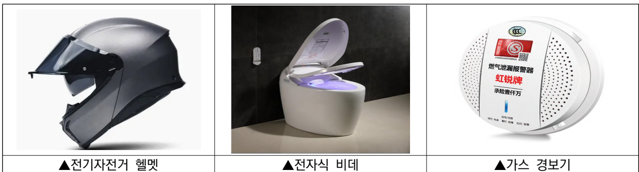
〈2025년 시행 예정인 강제성 인증 대상 품목〉

• 한편, 시장감독관리총국은 지난 2023년 12월 31일 <강제성 인증에 관한 공고문>을 통해 2024년 1월 1일부터 강제성 인증에 대한 전자인증서 발급 시행