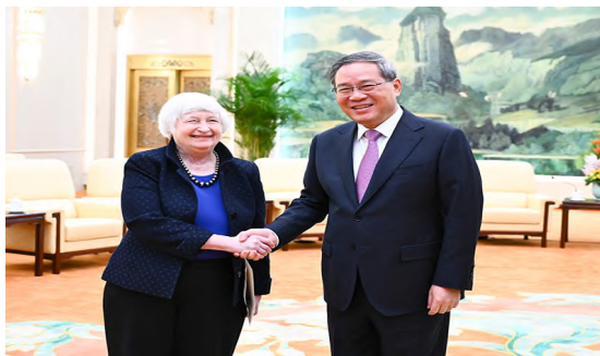
리창 총리, 옐런 美 재무장관 회견 모습