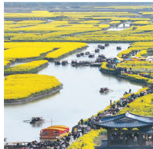
장쑤성 심화(兴化)시 천타(千垛) 관광지