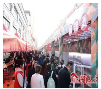
간쑤 텐수이(天水) 마라탕(麻辣烫) 거리