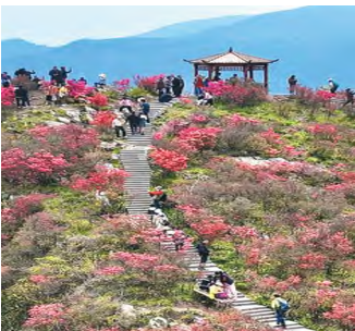
안후이성 우후(芜湖)시 산공산(三公山) 관광지