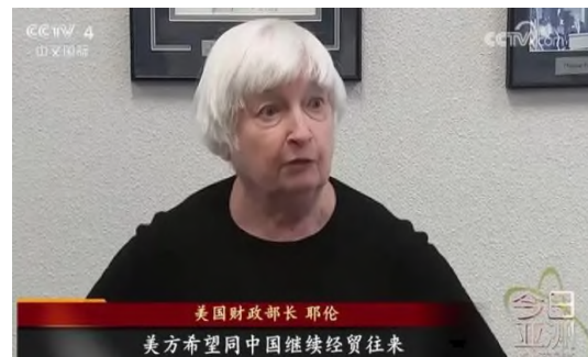
CCTV4(중문국제) 옐런 재무장관 인터뷰 방영 (*미국은 중국과 경제무역 교류 지속 희망)