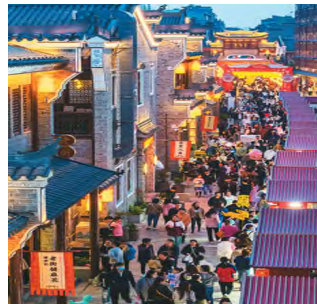
후베이성 상양(襄阳) 고성