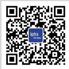
Kotra BizNews 쿼알코드