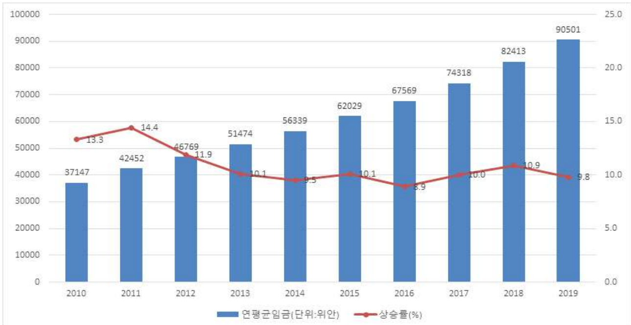
《2010-2019년 도시지역 비사영단위 취업인원 연평균임금》