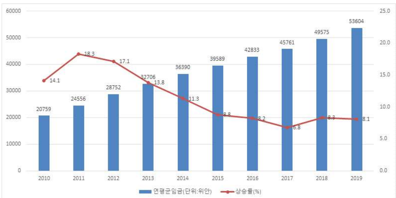
《2010-2019년 도시지역 사영단위 취업인원 평균임금》