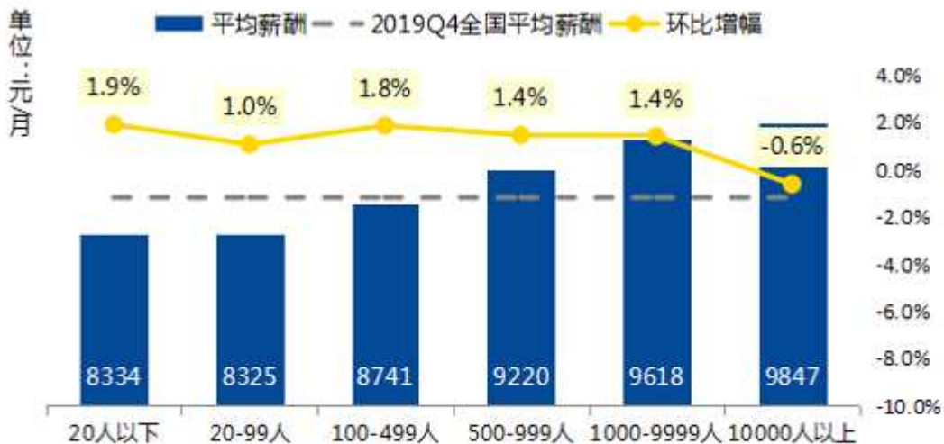
不同规模企业2019年冬季求职期平均薪酬