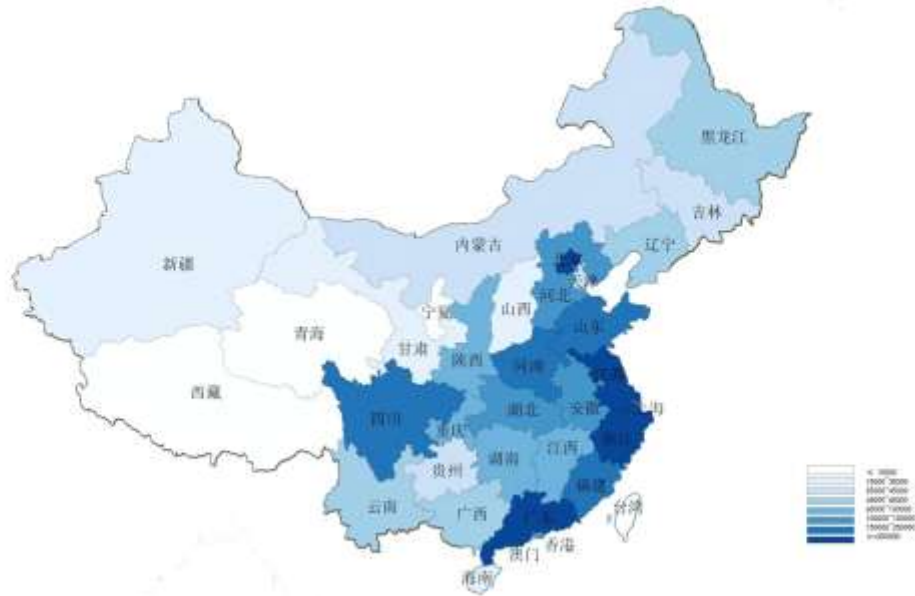
2017년 각 성(시) 상표출원 지역 분포도

전체적으로 보았을 때, 경제가 발달한 지역(예를 들면 광둥을 대표로 하는 연해도시)의 상표출원량은 경제가 발달하지 못한 지역(예를 들면 서부지역)에 비하여 많다.