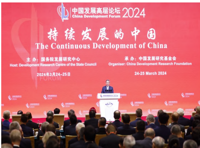
▲ 리창 총리 중국발전고위급포럼 개막식 연설