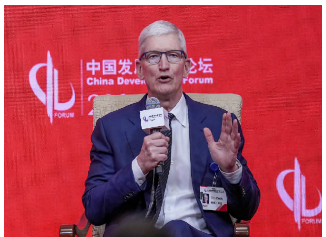
▲ 애플 최고경영자 팀 쿡 중국발전고위급포럼 참석