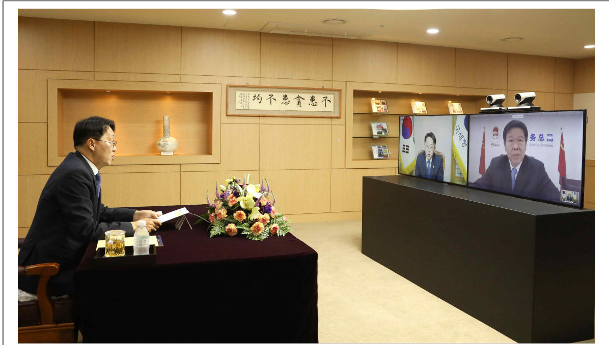
【사진설명】 김현준 국세청장이 왕 쥘(王軍) 중국 국세청장과 화상회의를 하는 모습