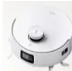
사투리를 구사하는 로봇청소기