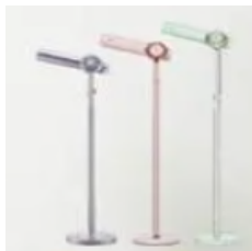
바닥 고정형 헤어드라이어